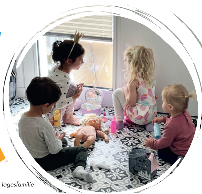
Kinder in der Tagesfamilie

Das Jahr 2025 war für die Tagesfamilien ein Jahr der Veränderung und der Weiterentwicklung. Mit grossem Engagement, viel Flexibilität und starkem Zusammenhalt haben wir wichtige Schritte unternommen, um unsere Organisation zukunftsorientiert aufzustellen und gleichzeitig die hohe Qualität unserer Betreuung weiter zu stärken.